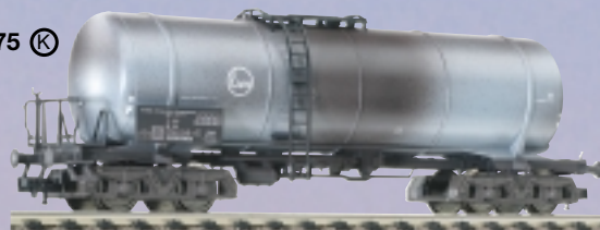
85 5475 · Kesselwagen „Eva“