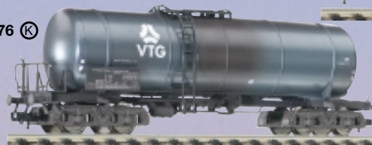
85 5476 · Kesselwagen „VTG“