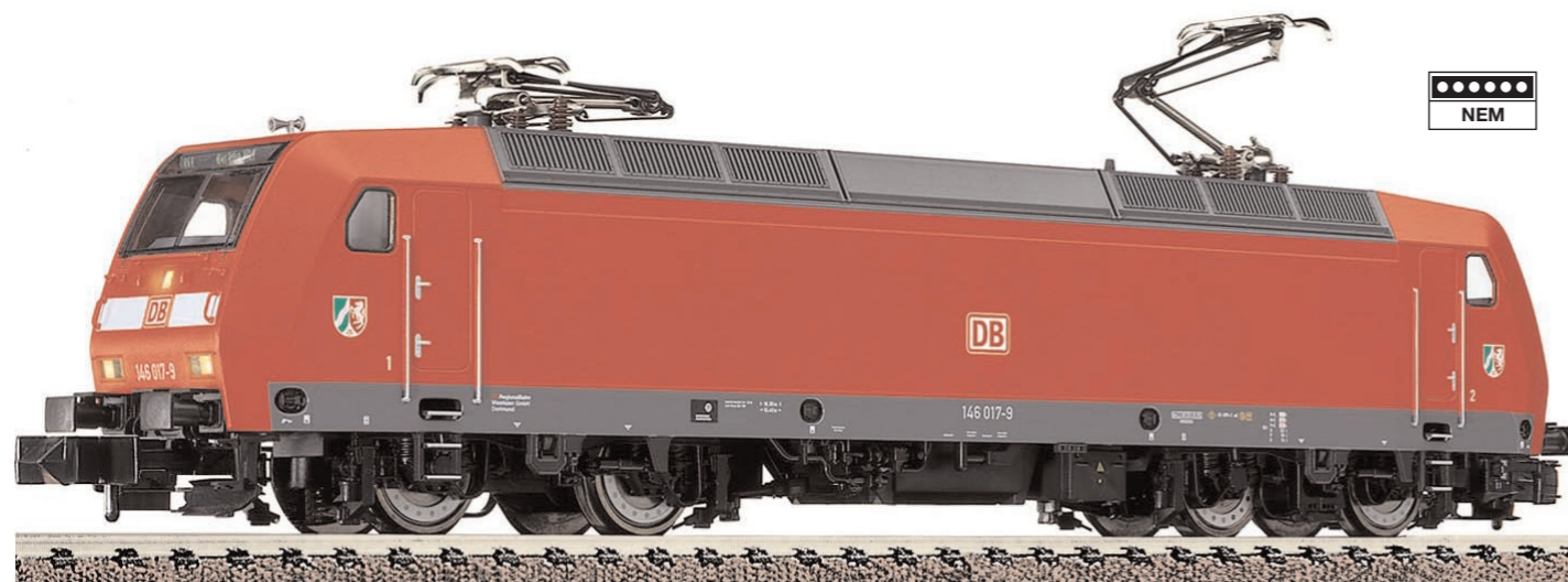
N Ellok der DB AG, BR 146, Epoche V, Art. 7324