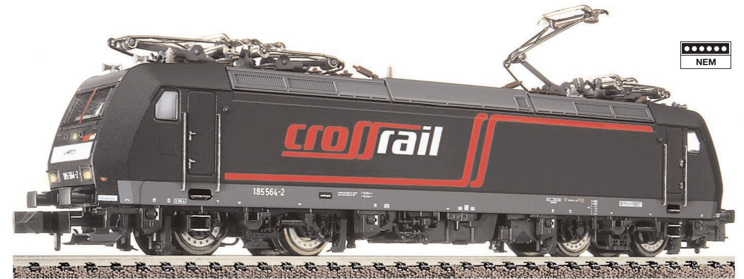
N Ellok der Crossrail AG, BR 185, Epoche V, Art. 87 7385

... und viele weitere Neuheiten – jetzt bei Ihrem Fachhändler!