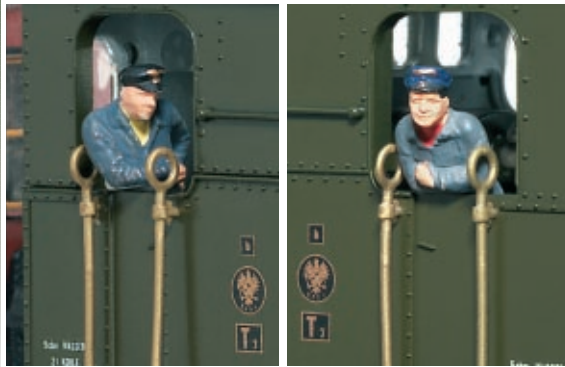
▲ Zuglok mit Lokführer- und Heizerfigur