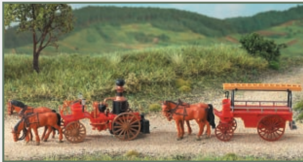
▲ Im Lieferumfang enthalten: 4 Pferde für die Weiterbeförderung der Feuerwehrfahrzeuge auf der Straße

Lupenreine Optik: Güterwagen mit filigranen Speichen- rädern und niedrigen Spur- kränzen