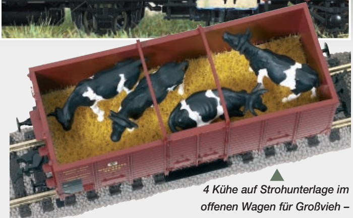
▲ 4 Kühe auf Strohunterlage im offenen Wagen für Großvieh – der wachsame Schaffner auf der Plattform (oben) hat sie stets im Blick