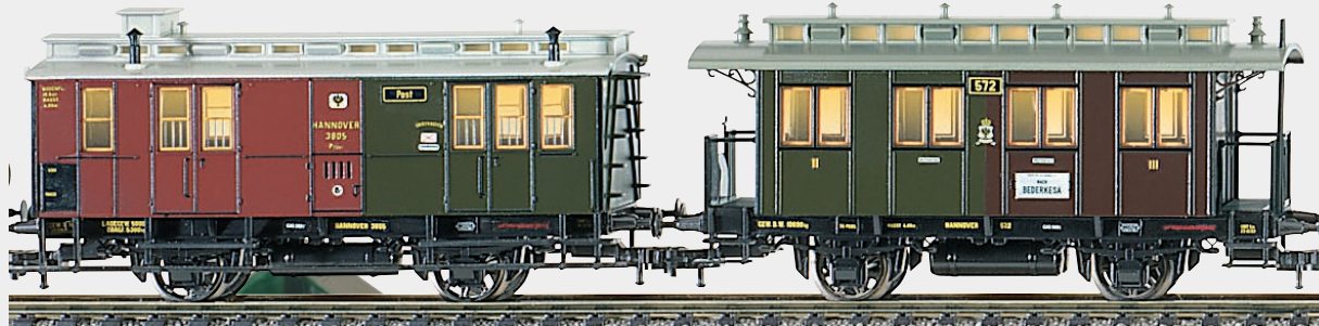
▲ Reisezugwagen mit Innenbeleuchtung und epochengerechten Reisenden & Bahnbeamten · Innenbeleuchtung nicht bei Art. 1904