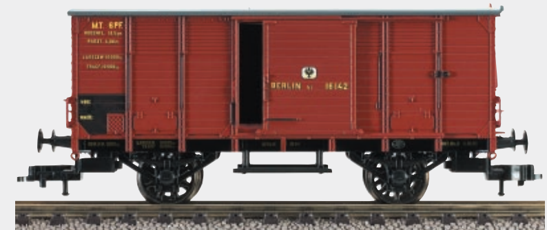
▲ Premiere in der Epoche I: gedeckter Länderbahn-Güterwagen