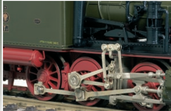
Exzellent: die filigrane Allan-Steuerung ▲