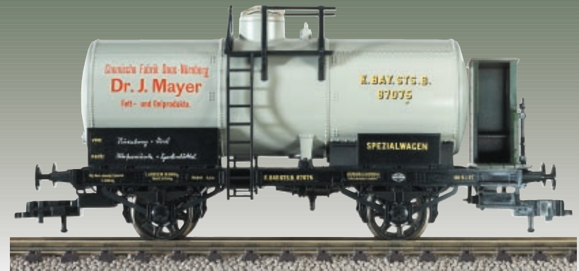
▲ Petroleumtransportwagen der Nürnberger Firma Dr. J. Mayer