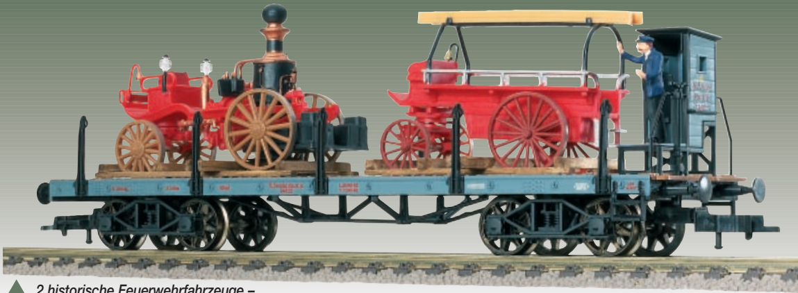
▲ 2 historische Feuerwehrfahrzeuge – Dampfspritze und Mannschaftswagen – sachgerecht auf Rungenwagen verladen · ▲ Bremsenfigur am Bremsenhaus