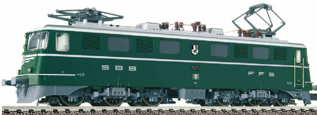
Handmuster mit vorläufiger Beschriftung